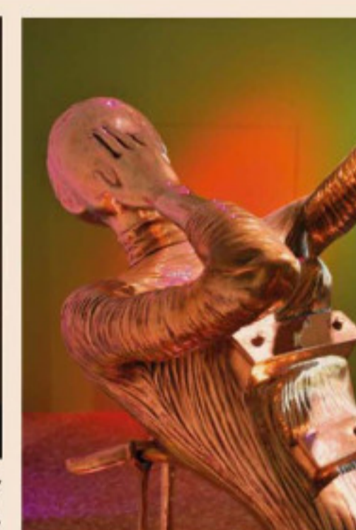
Da sinistra "Deredia" al Palaexpo di Roma; "Dali" a Palazzo Belloni di Bologna e, più sotto, "One Planet One Future" a Castel Dell'Ovo a Napoli. In alto "I Preraffaelliti" a Palazzo Reale di Milano